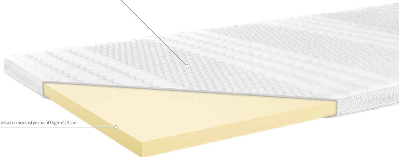
pianka termoelastyczna 50 kg/m 3 | 4 cm