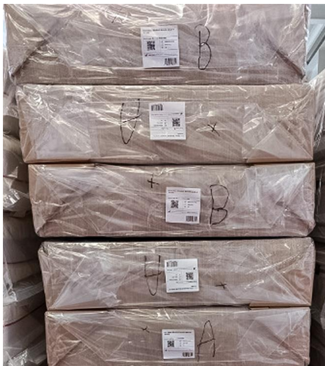
Rys 1. Sposób opisywania baz